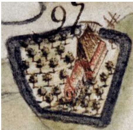
De boerderij 'Arbere' op een landmeterskaart van 1735.

De oudste vermelding van zo'n kloosterboerderij in oorkonden van de abdij is de boerderij Arbere bij Fransum.