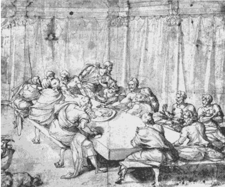
De werktekening die Jan van Scorel maakte voor zijn altaarstuk voor Aduard. (Staatliche Graphische Sammlung, München)

Volgens het schilderboek van Karel van Mander heeft Jan van Scorel aan het begin van de 16e eeuw een altaarstuk voor de Friese abdij 'Grootouwer' gemaakt, voorstellende het Laatste Avondmaal met levensgrote figuren. Dit schilderij is verloren gegaan, maar een werktekening ervan bevindt zich in München in de 'Staatliche Graphische Sammlung'.